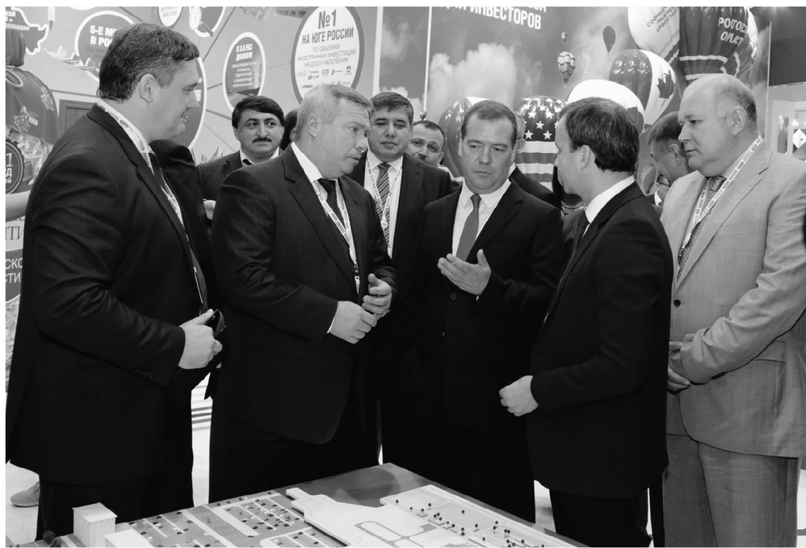
Дмитрий Медведев высоко оценил наши инвестиционные притязания

Это первый шаг в создании легкомышленного класте-